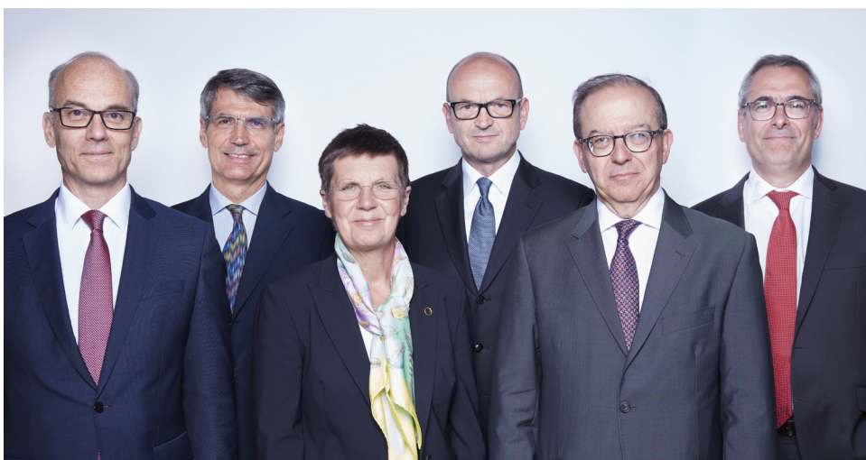
Членове на Съвета на ЕСП през 2018 г.