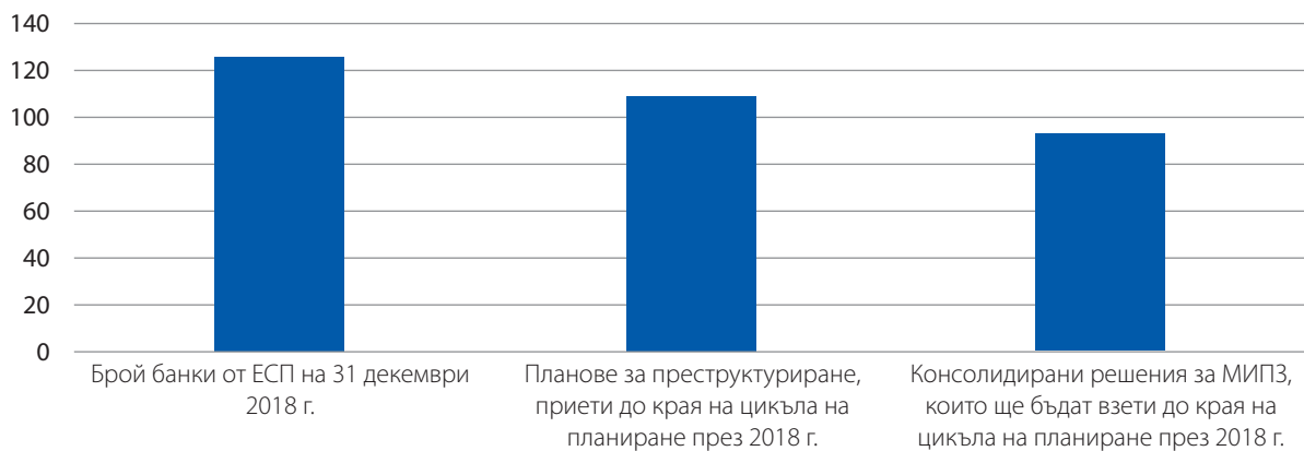
Фигура 1. Накратко относно планирането на реструктурирането