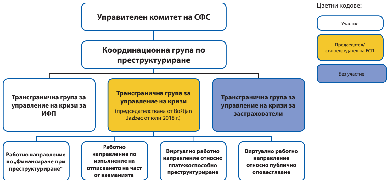
Таблица 3. Комитети, групи и работни направления на СФС в областта на реструктурирането