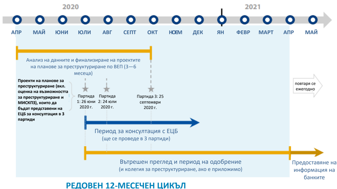
Фигура 1: Ключови елементи на ЦПП през 2020 г. — Хронология

През лятото на 2020 г. ЕСП създаде Служба за планиране на реструктурирането (СПП), която предоставя на звената по реструктурирането в трите дирекции по реструктуриране оперативна подкрепа относно планирането и изпълнението на ЦПП. СПП допринася също и за последователното прилагане на стратегиите на ЕСП и служи като единна точка за контакт по отношение на управлението на ЦПП.